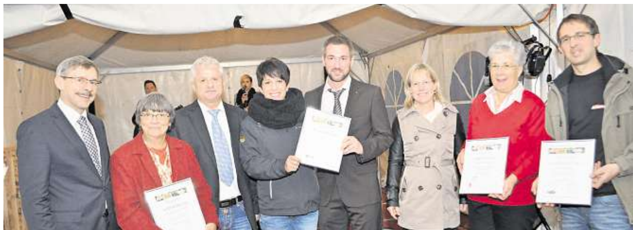
Loorbeeren für freiwilliges Engagement zugunsten der Gesellschaft: Die Delegierten der Prix-Benevol-Gewinner mit ihren Laudatoren.

Eine nette Überraschung gabs am Samstag für den Gastgeberverein der Prix-Benevol-Preisverleihung in Sargans: Die Jury hat den Eispark Sarganserland zum Gesamtsieger erkoren. Hauptgewinnerin war derweil der «Geist der guten Sache».